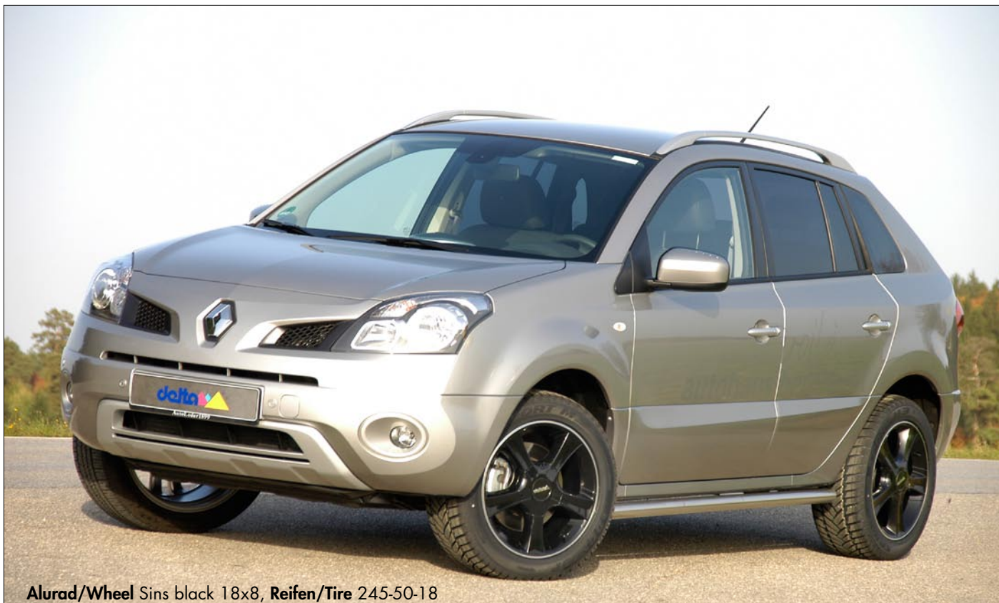
Alurad/Wheel Sins black 18x8, Reifen/Tire 245-50-18