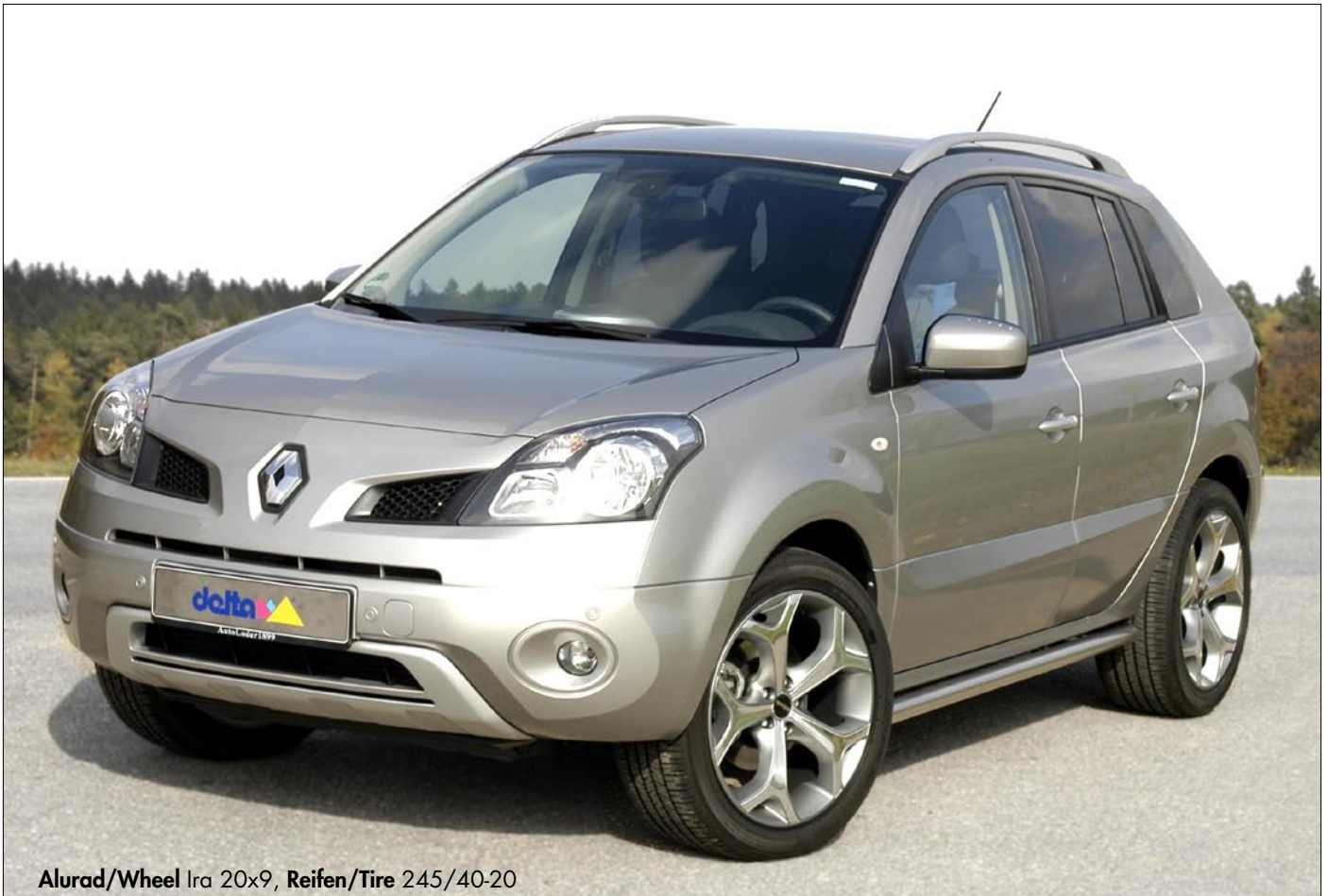
Alurad/Wheel Ira 20x9, Reifen/Tire 245/40-20

Felgen und Reifen sind wesentliche Elemente , die nicht nur Fahrverhalten und Sicherheit bestimmen, sondern auch die Optik eines Fahrzeuges entscheidend beeinflussen. Räder, die wir herstellen lassen oder ins Programm nehmen, suchen wir wie Edelsteine aus. Die Bandbreite reicht von Designerfelgen mit und ohne Edelstahltiefbett (Lander, Sins) über Hohlspokefelgen von innovativster Technik (delta HallowSpoke, die weltweit erste Aftermarkt Hohlspokefelge für SUV) bis zur Felge delta Romm von Kosei, dem japanische Hersteller, der es – dank Hightech-Engineering – versteht, fein gezeichnete Monoblock-Felgen auf die hohen Radlasten der Geländewagen auszulegen.