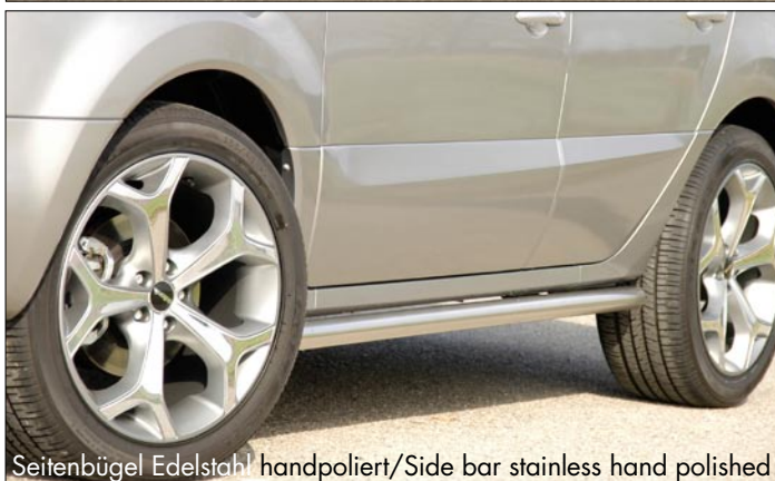
Seitenbügel Edelstahl handpoliert/Side bar stainless hand polished