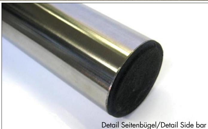
Detail Seitenbügel/Detail Side bar