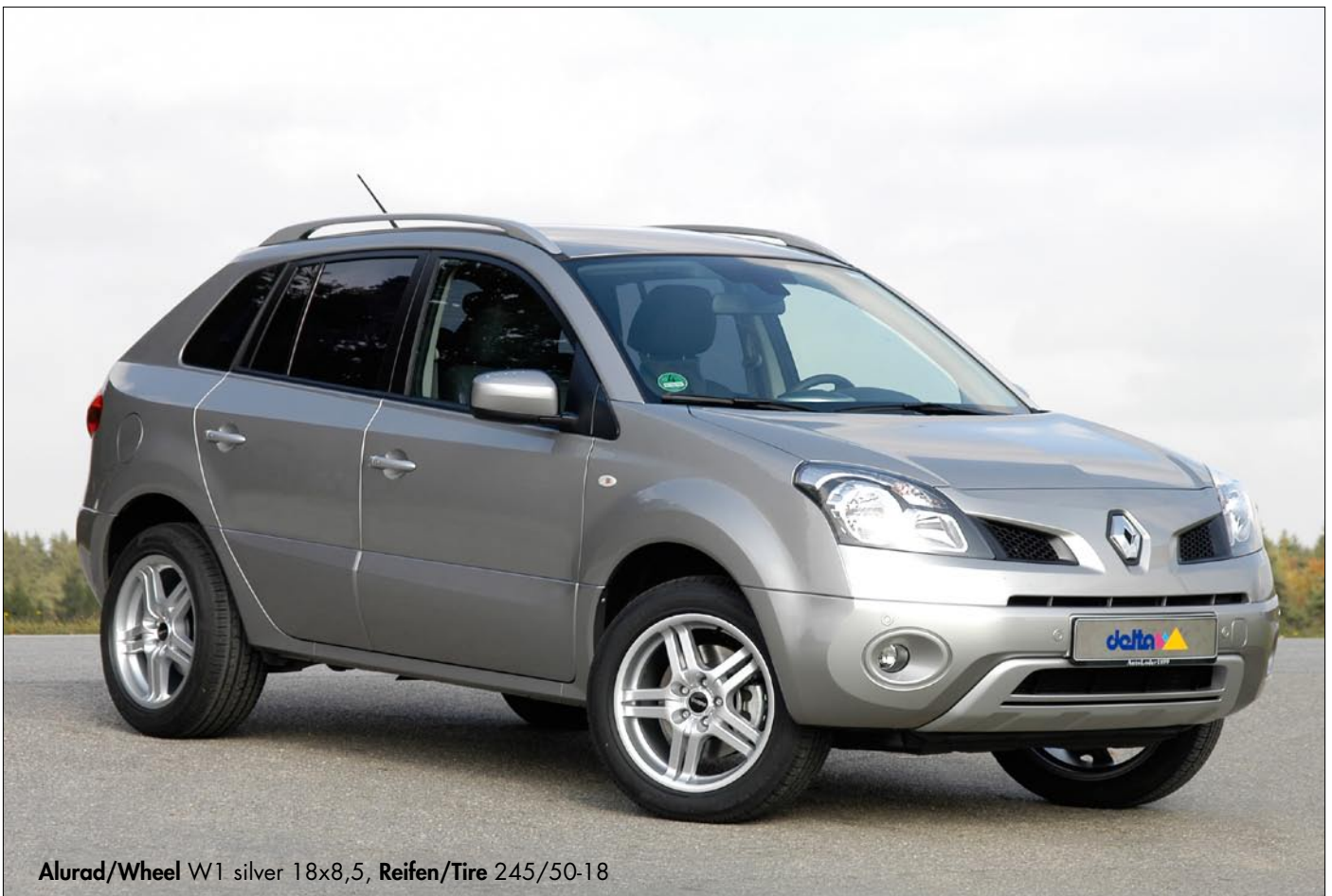
Alurad/Wheel W1 silver 18x8,5, Reifen/Tire 245/50-18