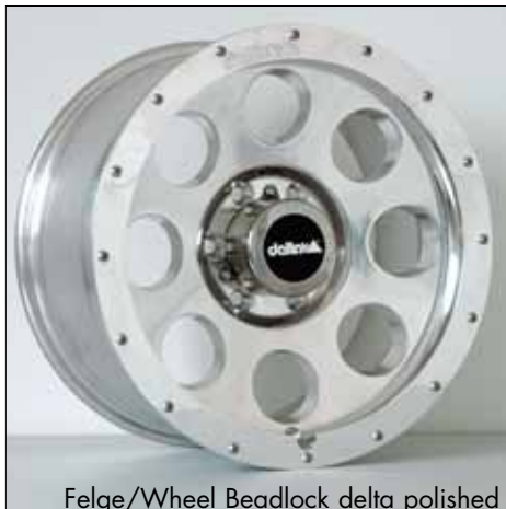
Felge/Wheel Beadlock delta polished