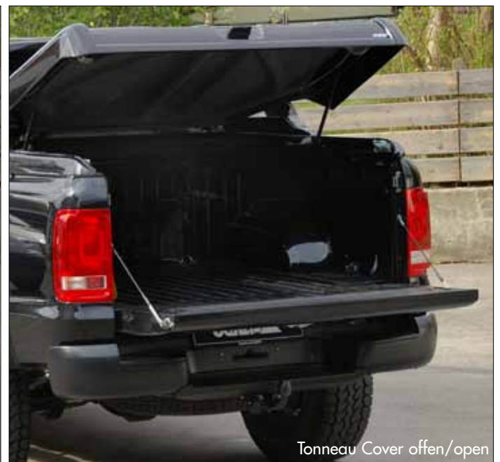
Tonneau Cover offen/open