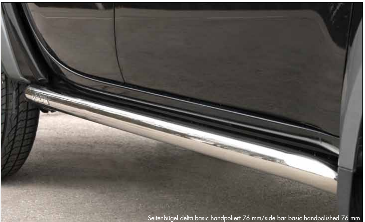
Seitenbügel delta basic handpoliert 76 mm/side bar basic handpolished 76 mm