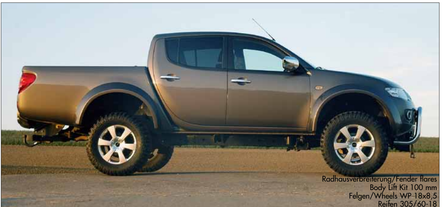
Radhausverbreiterung/Fender flares Body Lift Kit 100 mm Felgen/Wheels WP 18x8,5 Reifen 305/60-18