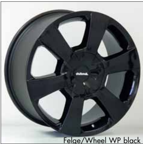
Felge/Wheel WP black