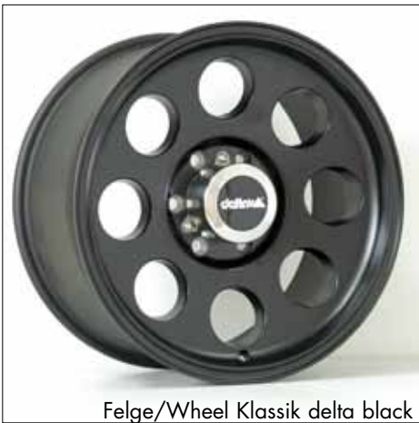
Felge/Wheel Klassik delta black