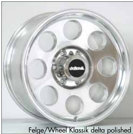
Felge/Wheel Klassik delta polished