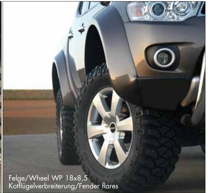
Felge/Wheel WP 18x8,5 Kotflügelverbreiterung/Fender flares