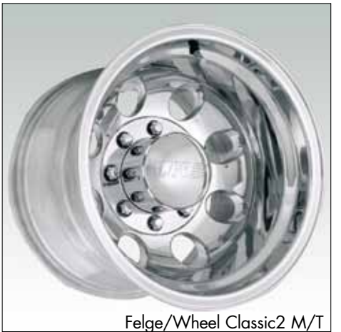
Felge/Wheel Classic2 M/T