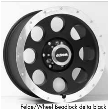
Felge/Wheel Beadlock delta black