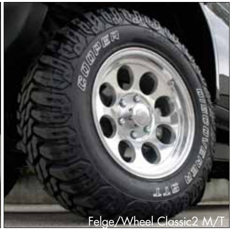
Felge/Wheel Classic2 M/T