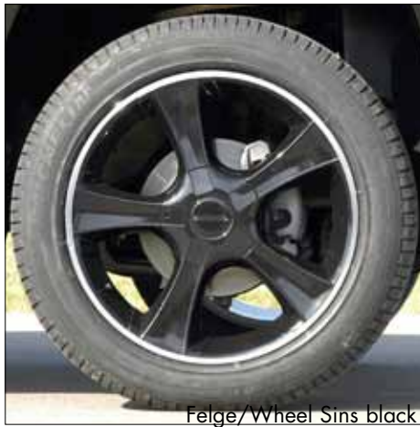
Felge/Wheel Sins black