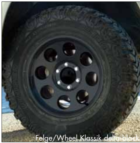
Felge/Wheel Klassik delta black