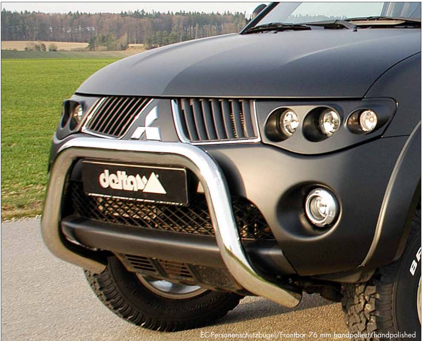
EC-Personenschutzbügel/Frontbar 76 mm handpoliert/handpolished