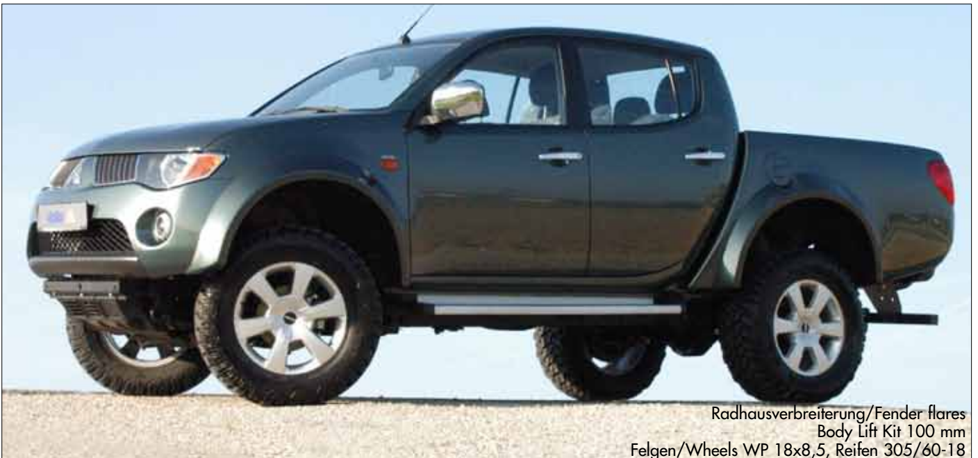
Radhausverbreiterung/Fender flares Body Lift Kit 100 mm Felgen/Wheels WP 18x8,5, Reifen 305/60-18