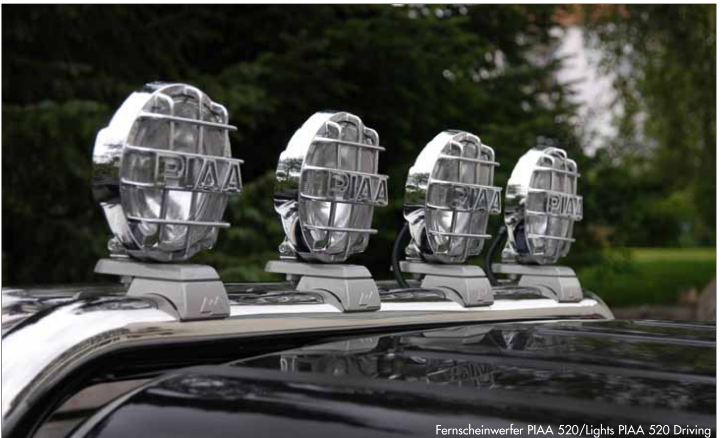
Fernscheinwerfer PIAA 520/Lights PIAA 520 Driving