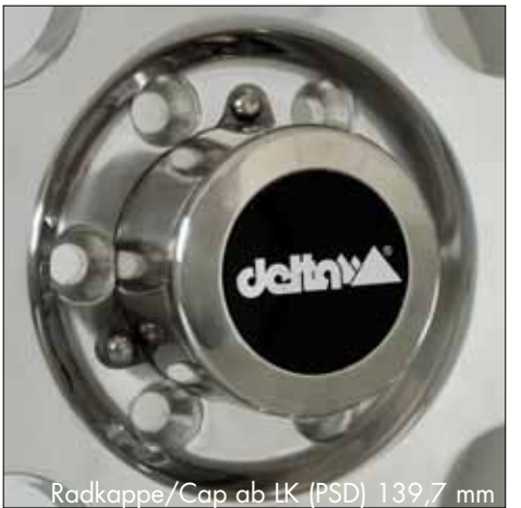
Radkappe/Cap ab HK (PSD) 139,7 mm