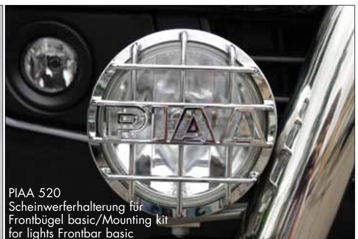
PIAA 520 Scheinwerferhalterung für Frontbügel basic/Mounting kit for lights Frontbar basic