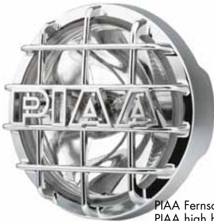
PIAA Fernscheinwerfer/ PIAA high beam SSR 520