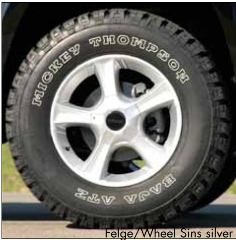
Felge/Wheel Sins silver