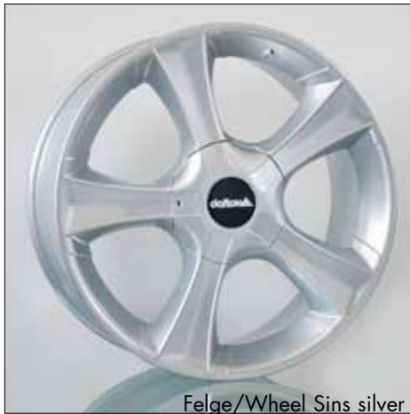
Felge/Wheel Sins silver