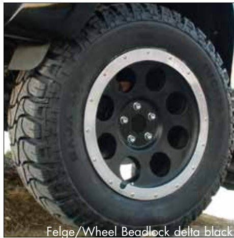
Felge/Wheel Beadlock delta black