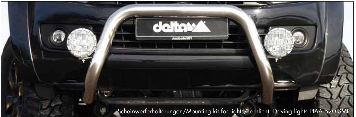
Scheinwerferhalterungen/Mounting kit for lights/Fernlicht, Driving lights PIAA 520 SMR