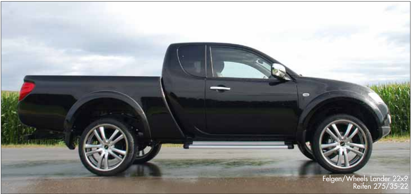
Felgen/Wheels Lander 22x9 Reifen 275/35-22