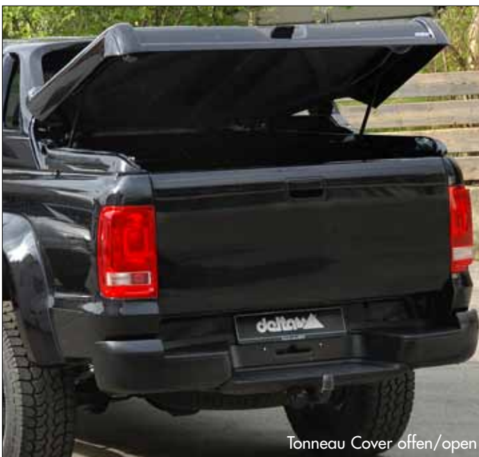
Tonneau Cover offen/open