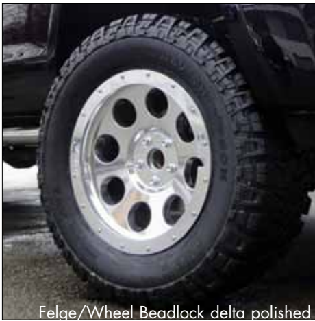
Felge/Wheel Beadlock delta polished