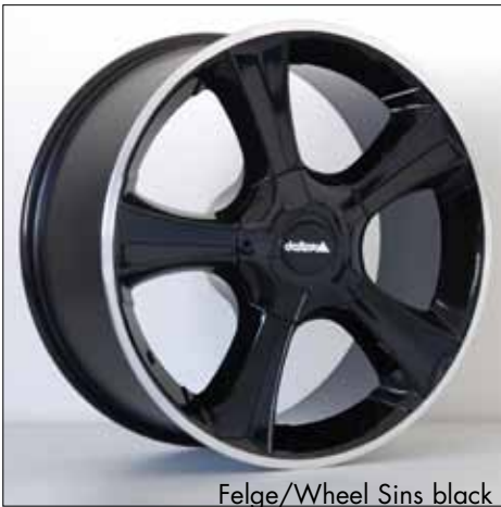
Felge/Wheel Sins black