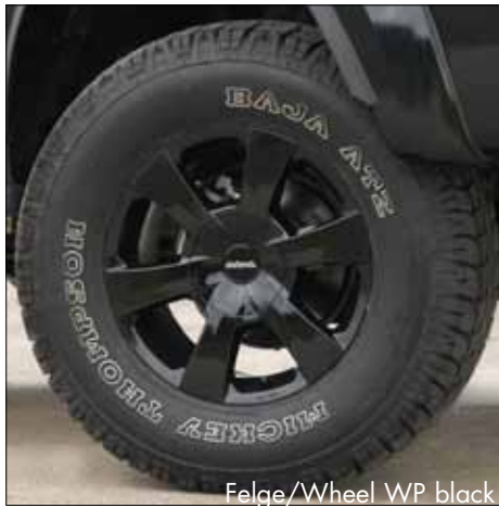
Felge/Wheel WP black