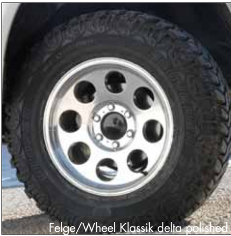
Felge/Wheel Klassik delta polished