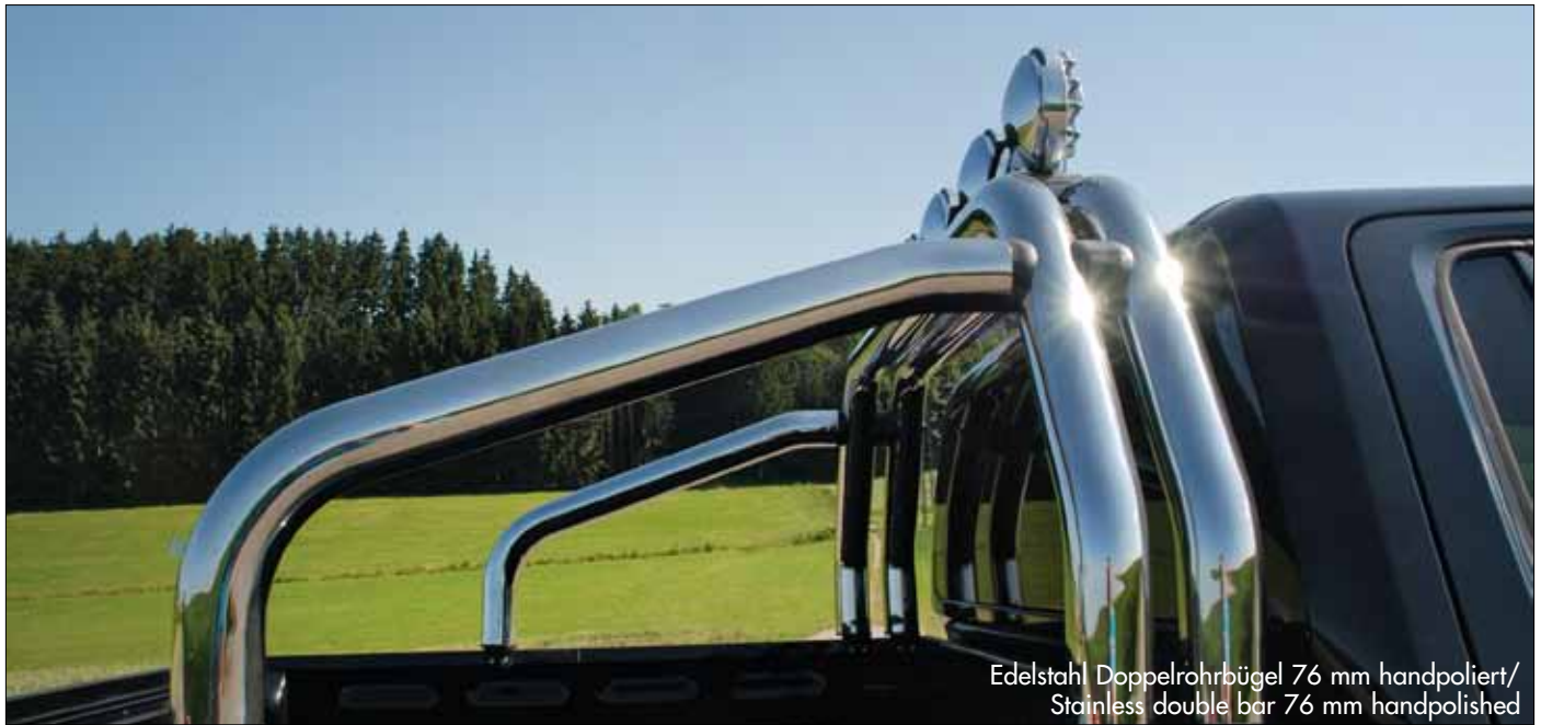
Edelstahl Doppelrohrbügel 76 mm handpoliert/ Stainless double bar 76 mm handpolished