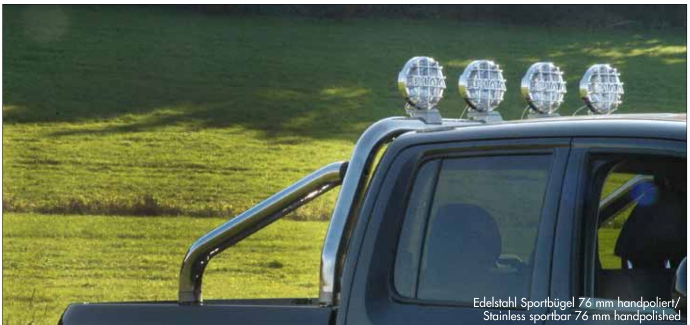
Edelstahl Sportbügel 76 mm handpoliert/ Stainless sportbar 76 mm handpolished