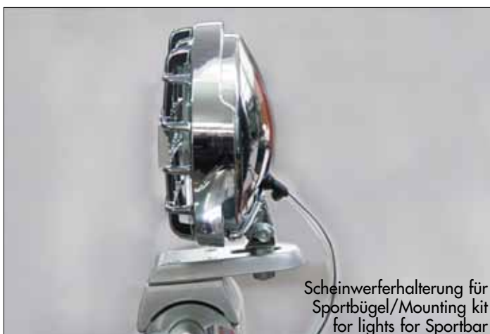
Scheinwerferhalterung für Sportbügel/Mounting kit for lights for Sportbar