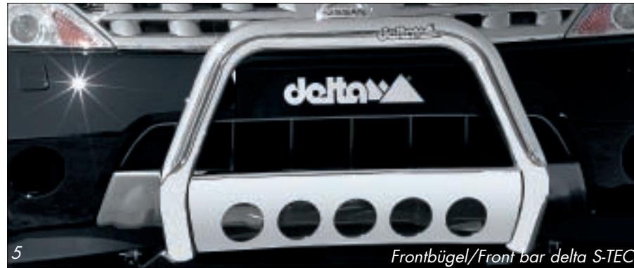
Frontbügel/Front bar delta S-TEC