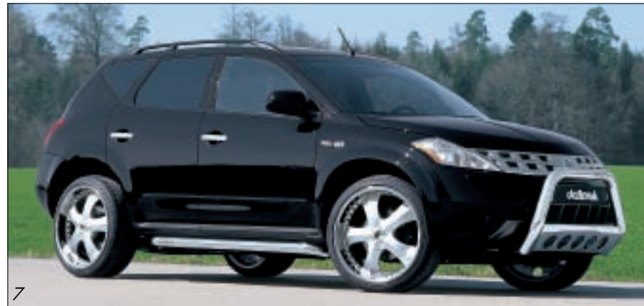
Alufelgen/Alloy wheels delta A5 10x22 Reifen/Tire 265/35-22 Frontbügel/Front bar delta S-TEC