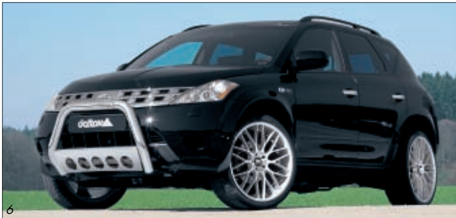
Alufelgen/Alloy wheels Romm 9,5x22 Reifen/Tire 265/35-22 Frontbügel/Front bar delta S-TEC