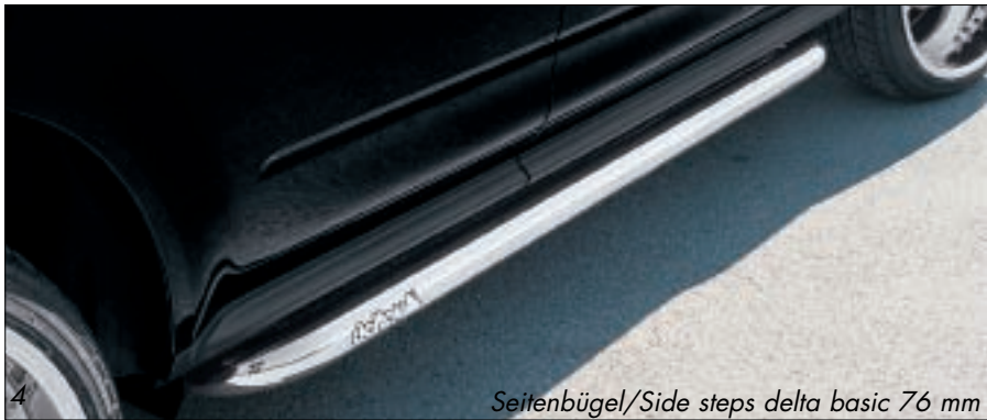
Seitenbügel/Side steps delta basic 76 mm